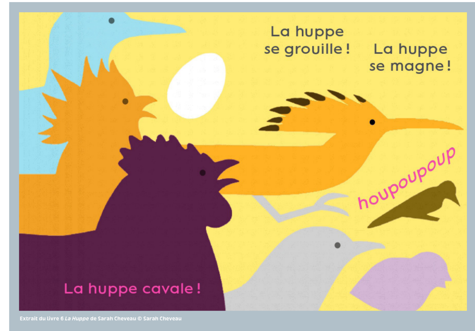
Extrait du livre 6 La Huppe de Sarah Cheveau © Sarah Cheveau

Une création musicale de Marylou et Nathan Luyé, Radio Oiseaux, accompagne la lecture de l'œuvre, à découvrir via le QR code! De l'œuf à la chouette en passant par le pic épeiche et le poussin, les jeunes auditrices et auditeurs sont embarqués dans un doux voyage au pays des oiseaux, dans leurs sonorités pour chanter avec eux et prendre le temps de les écouter.