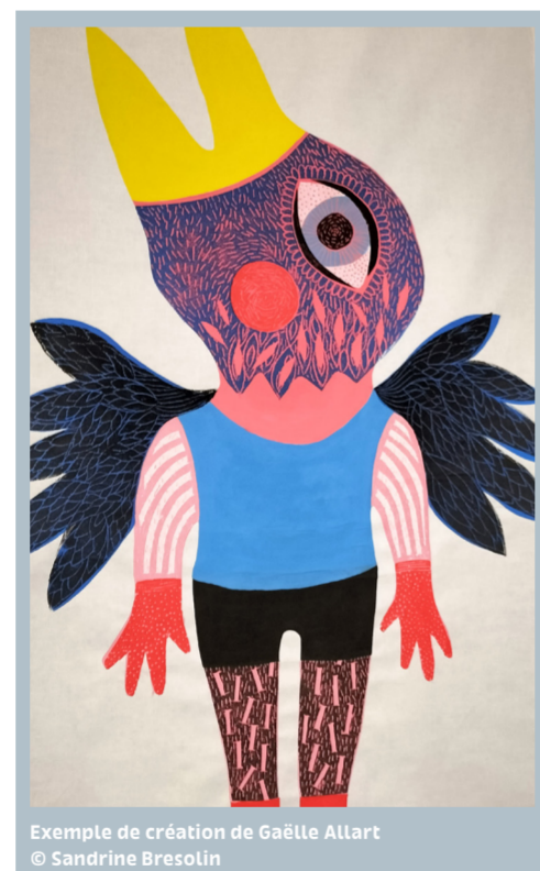
Exemple de création de Gaëlle Allart

Les ateliers de Gaëlle Allart permettront l'observation des oiseaux dans les tableaux du musée, leur imitation et la fabrication d'éléments de cartons. Puis tous les éléments, mis en commun, serviront à construire une œuvre commune et éphémère : un grand nid, ainsi que l'oiseau qui viendra s'y nicher !