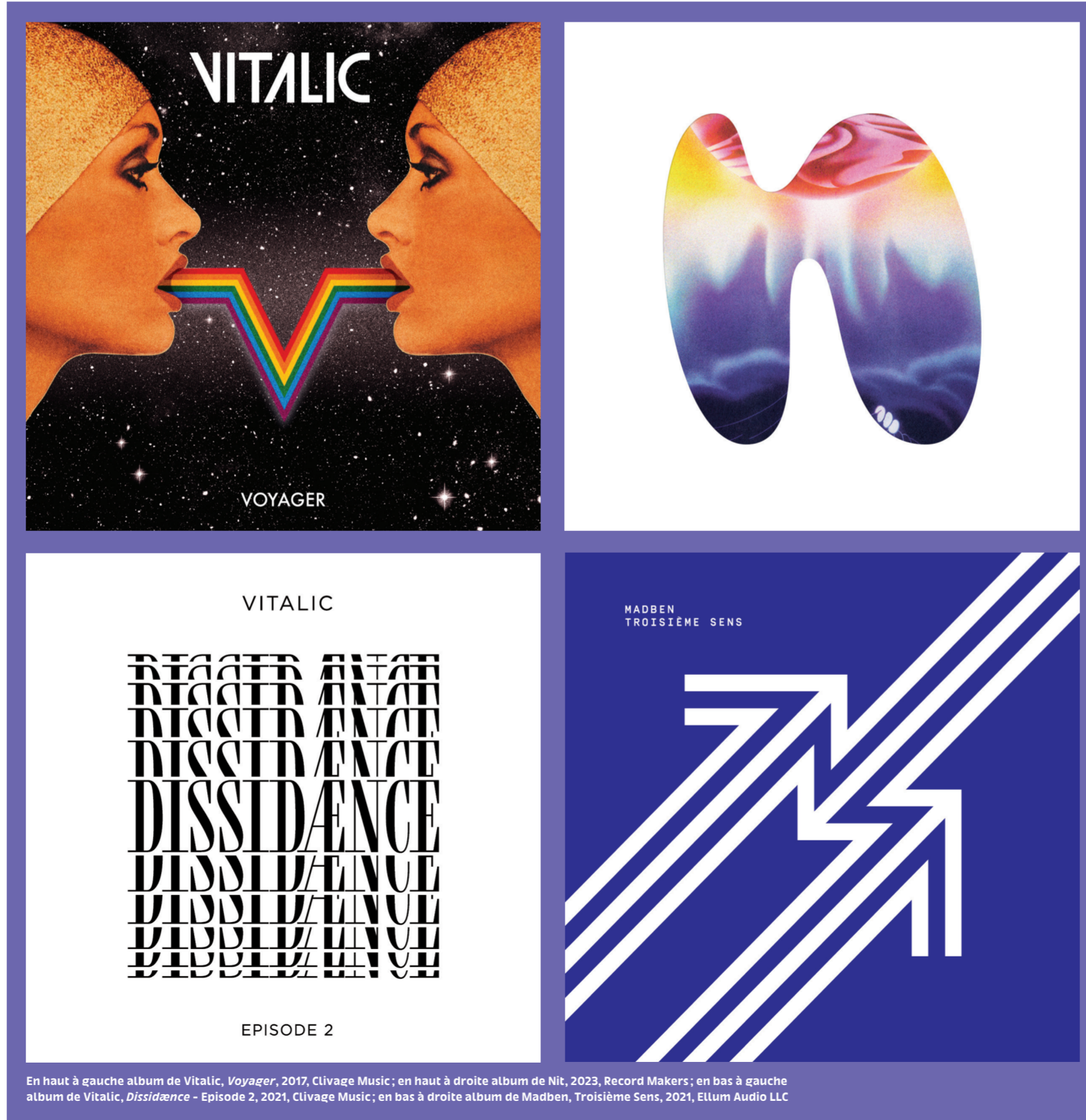
En haut à gauche album de Vitalic, Voyager , 2017, Clivage Music; en haut à droite album de Nit, 2023, Record Makers; en bas à gauche album de Vitalic, Dissidence - Episode 2 , 2021, Clivage Music; en bas à droite album de Madben, Troisième Sens , 2021, Ellum Audio LLC

Programme détaillé des activités sur www.cndg.fr