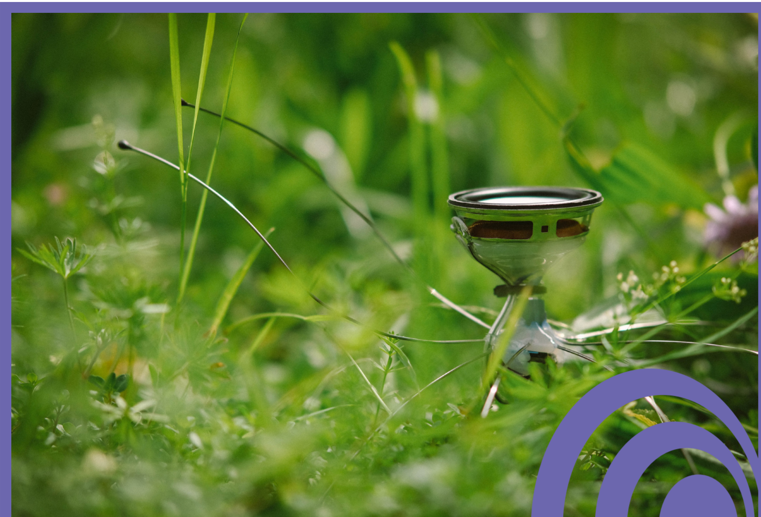
Los grillos del sueño de Félix Blume © Félix Blume